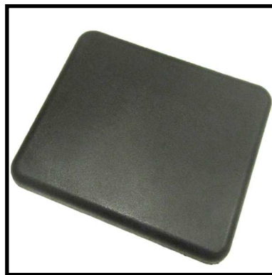
A152-02 ASIENTO ACOLCHADO.