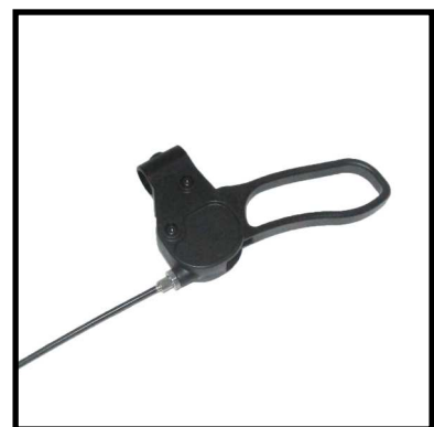
A152-12 MANETA FRENO CON CABLE.