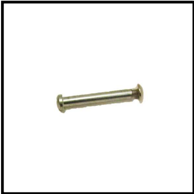
A152-09 EJE RUEDAS DELANTERO.