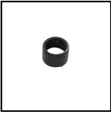
A160-10 TAPÓN REDUCTOR.