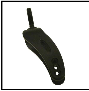
A152-07 HORQUILLA DELANTERA.