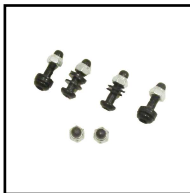
A152-05 TORNILLOS SISTEMA DE PLEGADO