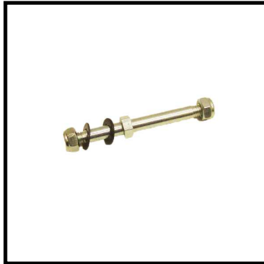
A152-10 EJE RUEDAS TRASERO.