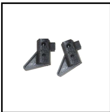
A152-04 PAR BISAGRA PLEGADO RESPALDO.