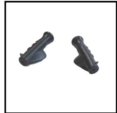
A160-05 PAR PUÑOS ANATOMICOS.