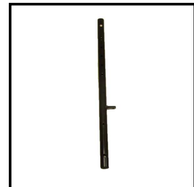
A152-16 TUBO REGULACIÓN ALTURA ASIENTO TRASERO.