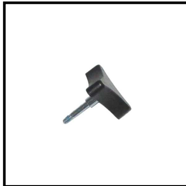
A160-07 POMO REGULACIÓN DE ALTURA.