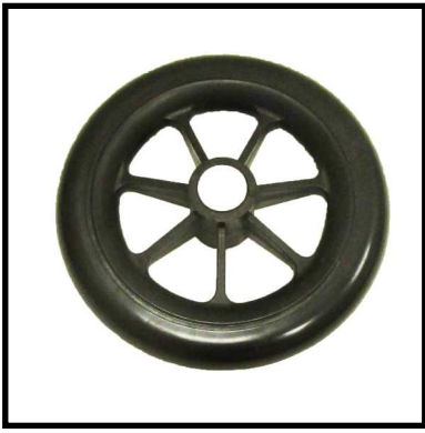
A152-06 RUEDA DELANTERA/ TRASERA.