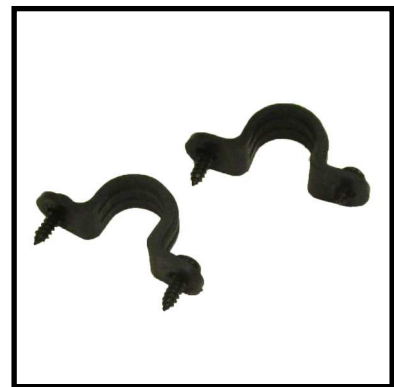
A152-03 GRAPAS ASIENTO.