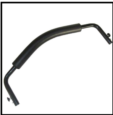
A152-01 RESPALDO COMPLETO.