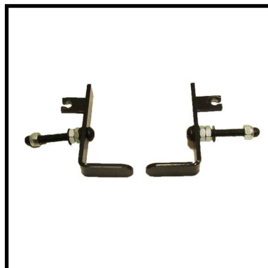
A152-14 PAR FRENOS RUEDA.