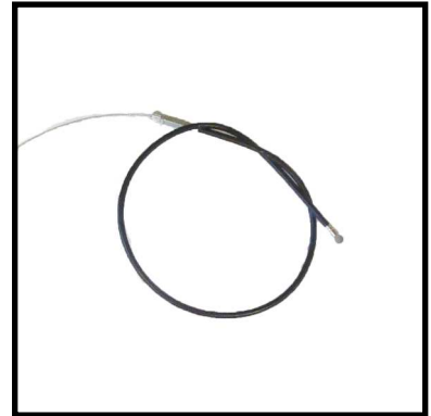
A152-11 CABLE FRENO.