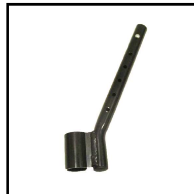
A152-15 TUBO REGULACIÓN ALTURA ASIENTO DELANTERO.