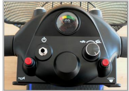
CUADRO DE MANDO Regulador velocidad Luces LED – Claxon Indicador carga batería