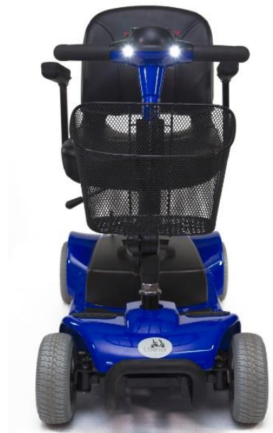
CESTA PORTA OBJETOS

CONFORT - PRESTACIONES - SEGURIDAD - DISEÑO