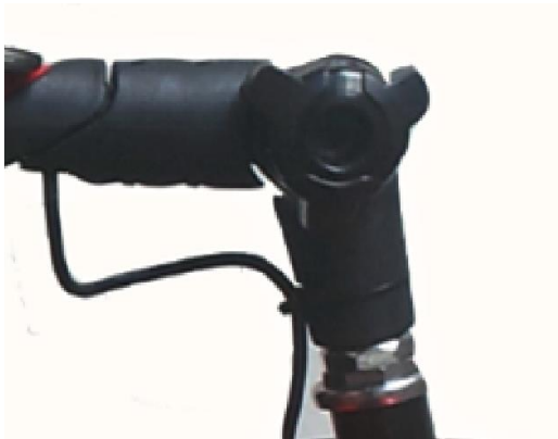
REGULADOR COLUMNA DIRECCIÓN