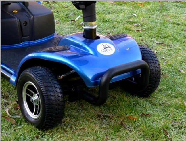
PARAGOLPES LLANTAS ALEACIÓN