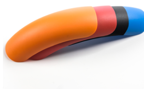
Kit de 4 colores para el guardabarros (incluidos de serie)