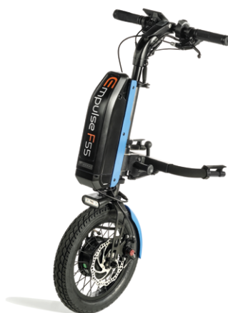
// EMF070086 Empulse F55 con rueda neumática de 14" (Mostrada con conexión para sillas con reposapiés fijos ref. EMF010027 y kit de color en azul)