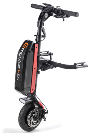
// EMF070085 Empulse F55 con rueda maciza de 8,5" (Mostrada con conexión para sillas con reposapiés fijos ref. EMF010027 y kit de color en rojo)