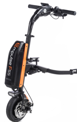
// EMF070085 Empulse F55 con rueda maciza de 8,5" (Mostrada con conexión para sillas con reposapiés desmontables ref. EMF010028 y kit de color en naranja)