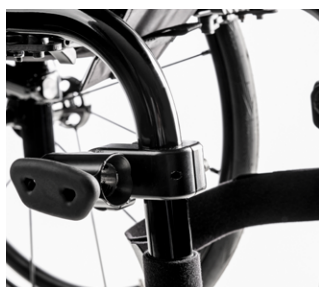
// EMF010029 Abrazaderas para sillas con tubos redondos (ajustable a tubos de 19.5 / 23 / 25 / 28.6 y 30 mm)