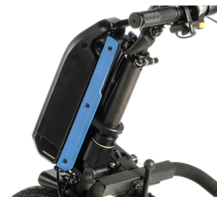
Kit de 4 colores para los laterales (incluidos de serie)