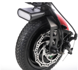
Luz delantera LED, guardabarros en rojo y freno de disco (mostrada en rueda maciza de 8,5")