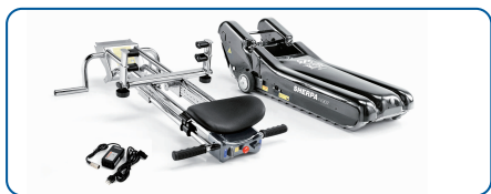
Transportable en piezas.