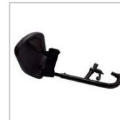
1M33300424R-08-U REPOSAPIES DERECHO