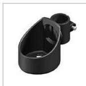
1M31000326-02-U PORTABASTÓN MÁS CINCHA UNIVERSAL