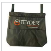
1446AC-19-U BOLSA UNIVERSAL BOLSILLO