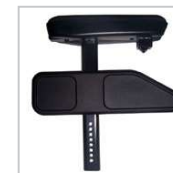
1M31000322-08-U REPOSABRAZOS DERECHO