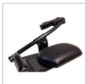
1M33403091-08-U 1M33403N91-08-U REPOSAPIES ELEVABLE