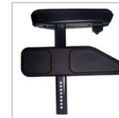
1M31000321-08-U REPOSABRAZOS IZQUIERDO