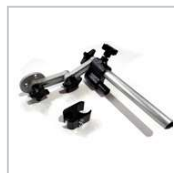
1NASJY003 SOPORTE MANDO ACOMPAÑANTE