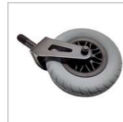
1M33100668-08-U RUEDA DELANTERA HORQUILLA