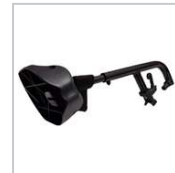
1M33300424L-08-U REPOSAPIES IZQUIERDO