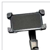
1NASP01-08-U SOPORTE DISPOSITIVOS MOVILES