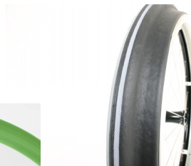
XFF070208 Aros Maxgrepp