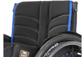
XFF 030317 Tapicería de respaldo EXO EVO PRO