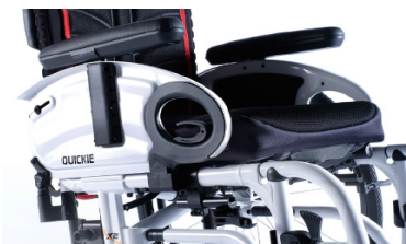
XFF04000x Reposabrazos de escritorio