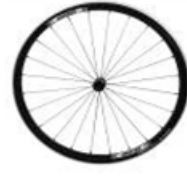
XFF07000 Ruedas traseras ultraligeras Proton