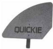
XFF040107 Protector lateral de plástico desmontable