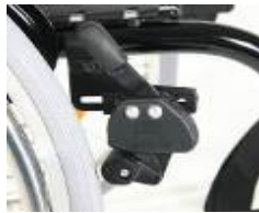
XFF060002 Freno de rodilla (montado alto)