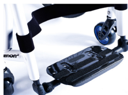
XFF050132 Plataforma única de fibra de carbono