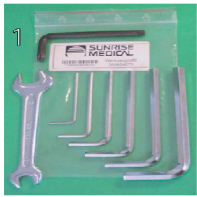
XFF090000 Kit de herramientas