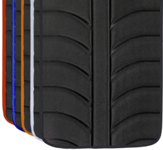
Colores ribetes tapicerías EXO EVO