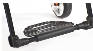
XFF050059 Plataforma de aluminio Xenon performance