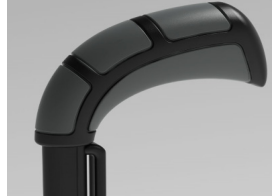
XFF 030201 Empuñaduras standard largas