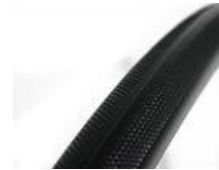
XFF070102 Cubiertas macizas