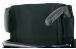
XFF 030203 Empuñaduras plegables