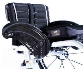
XFF040104 Protector lateral de carbono con fender