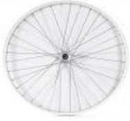
XFF070001 Ruedas traseras con radios cruzados