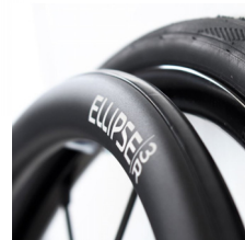
XFF070212 Ellipse 3R