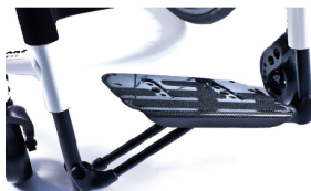
XFF050027 Plataforma autoplegable de carbono