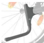
XFF090001 Tubos de cola