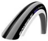
XFF070101 Cubiertas de alta presión lisas Right Run