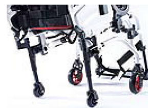
XFF090010 Ruedas de tránsito