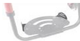
XFF050127 Posicionadores de pie para plataforma