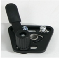
XFF060001 Freno standard