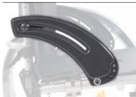
XFF040101 Protector lateral ligero pequeño