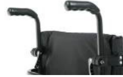
XFF 030204 Empuñaduras ajustables en altura