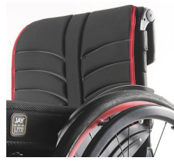
XFF 030316 Tapicería de respaldo EXO EVO