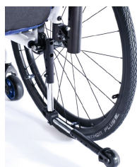
XFF090004 Ruedas antivuelco, abatibles