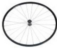
XFF070003 Ruedas traseras ligeras