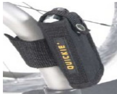
XFF090026 Soporte para móvil