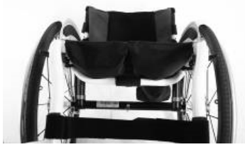
XFF 020003 Tapicería de asiento con 2 bolsillos