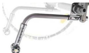
XFF090050 Ruedas antivuelco, no abatibles