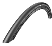
XFF070107 Cubiertas Schwalbe One