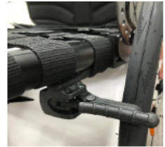
XFF060024 Freno compacto ligero EVO