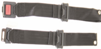
XFF 090018 Cinturón de posicionamiento con cierre