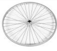
XFF070002 Ruedas traseras de diseño