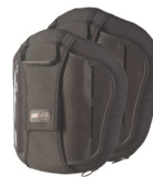
Torácico Medio (MT)