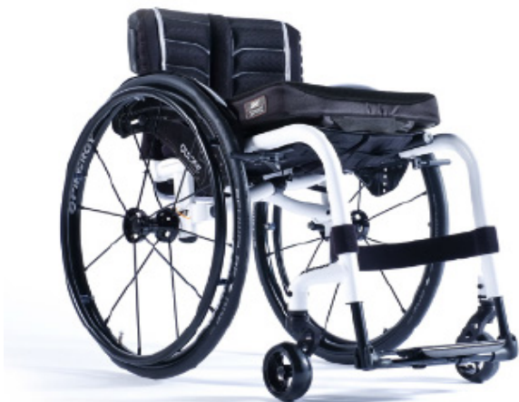
XFF010012 / 13 Armazón con reposapiés fijos