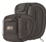
Torácico Inferior (LT)