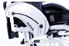
XFF040103 Protector lateral de aluminio (con fender)