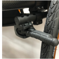
XFF060023 Freno compacto EVO