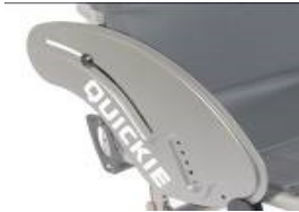
XFF040102 Protector lateral de aluminio (sin fender)