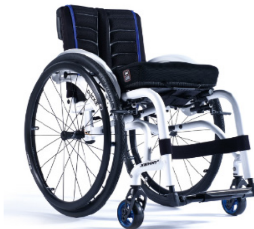
XFF090020 / 21 Armazón híbrido reforzado